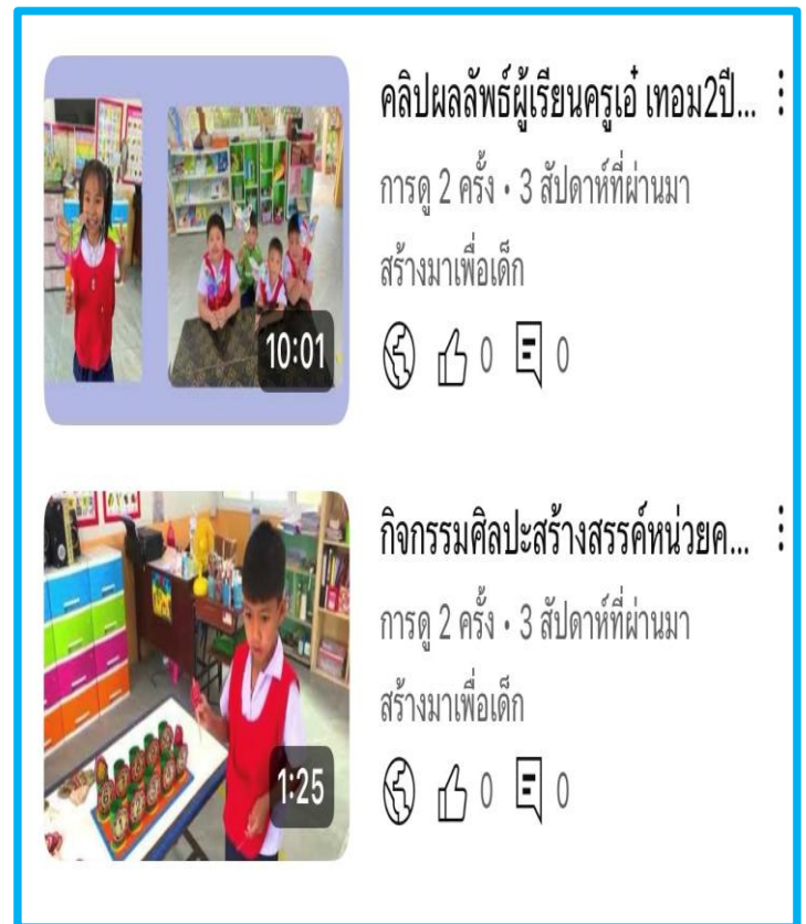
การเผยแพร่การจัดการเรียนรู้ (ยูทูป)