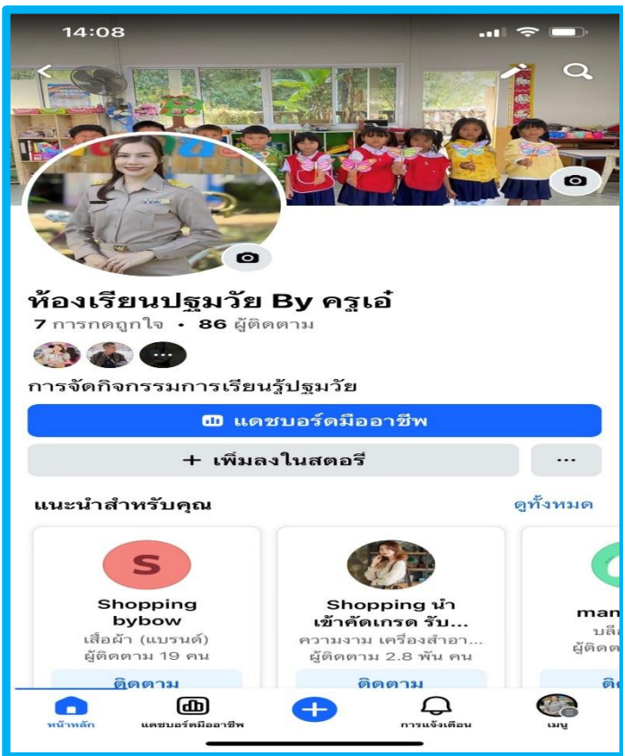
การเผยแพร่การจัดการเรียนรู้ (เฟสบุ๊ก)