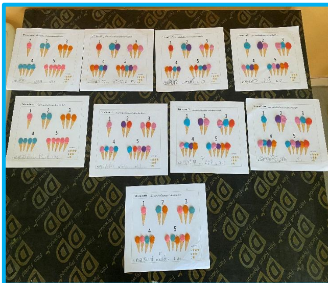
ผลงานนักเรียน