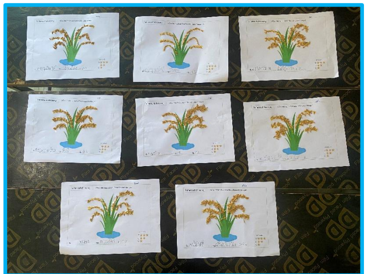
ผลงานนักเรียน