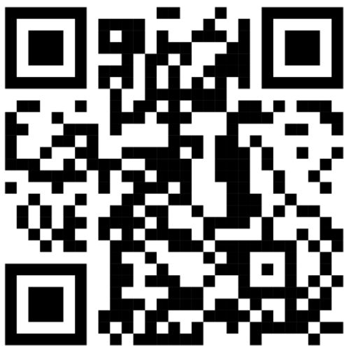
CAI บทที่ 3