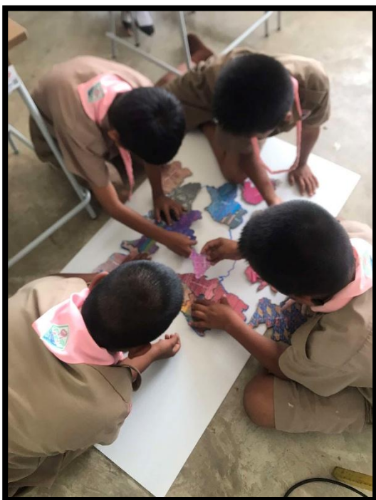
นักเรียนช่วยกันต่อจิ๊กซอว์