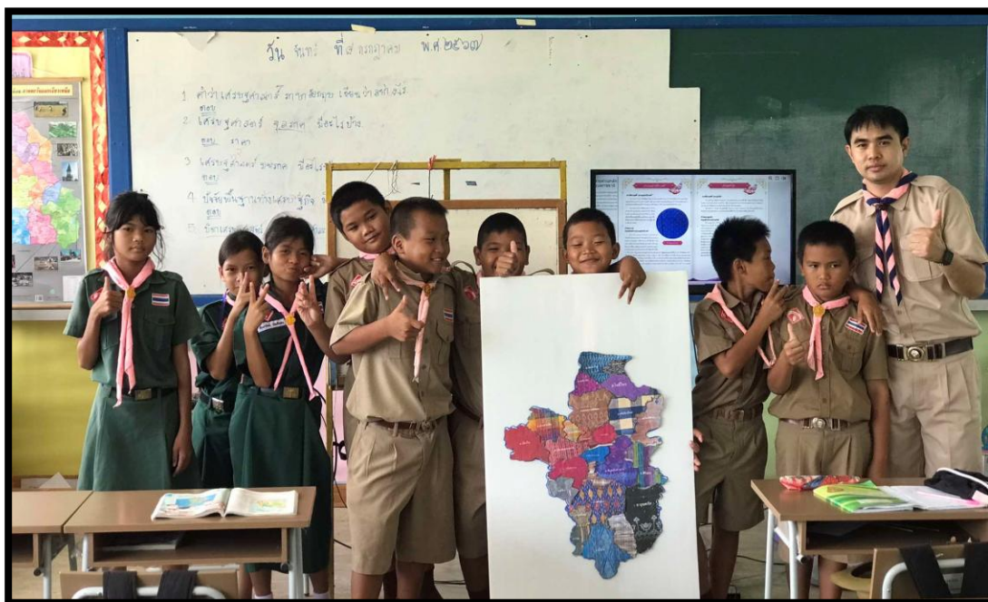
นักเรียนร่วมทำกิจกรรม เรื่อง ลวดลายผ้าและประวัติความเป็นมา