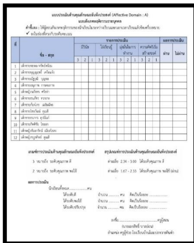
แบบวัดค่า P