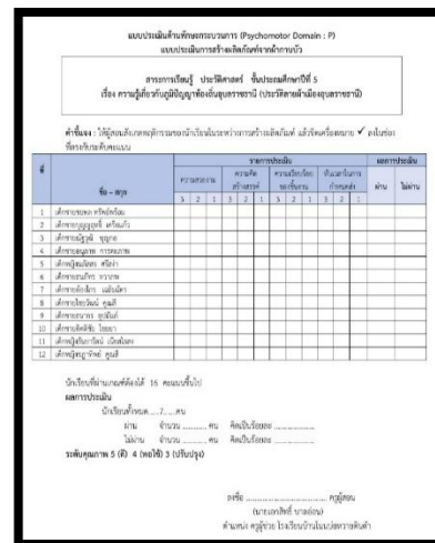
แบบวัดค่า A