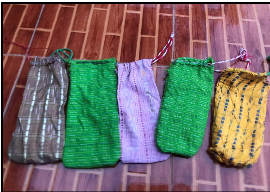
ผลิตภัณฑ์ของนักเรียนทำมาจากผ้ากาบบัว