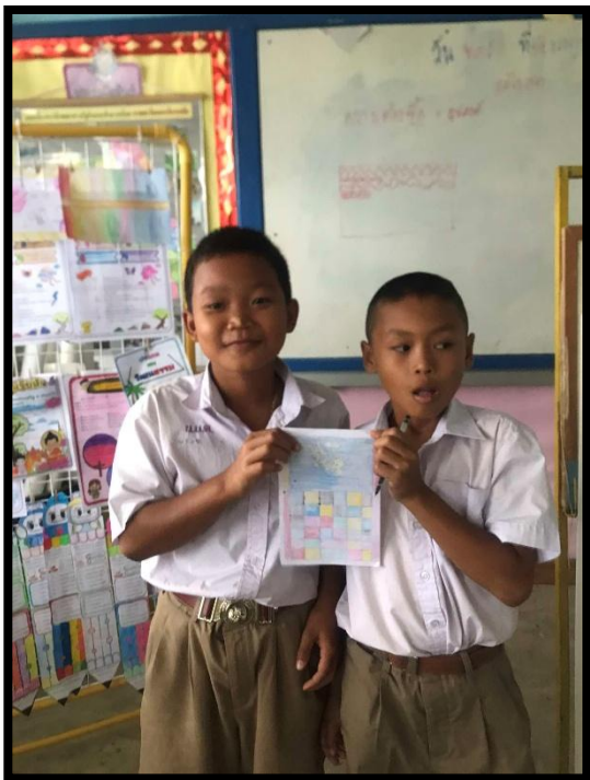
นักเรียนนำเสนอผลงาน