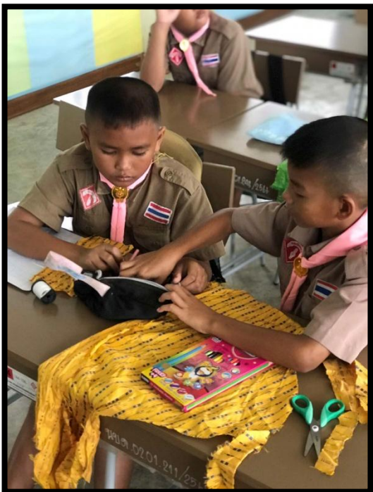
นักเรียนสร้างผลิตภัณฑ์