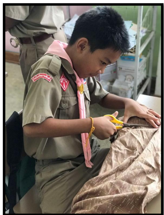
นักเรียนสร้างผลิตภัณฑ์