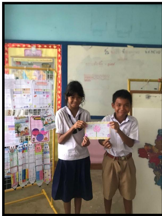
นักเรียนนำเสนอผลงาน