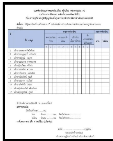
แบบวัดค่า k