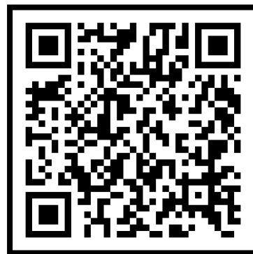
คลิปนักเรียนต่อจิ๊กซอว์ลายผ้า