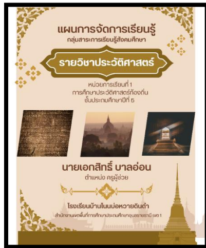
จัดทำแผนการจัดการเรียนรู้