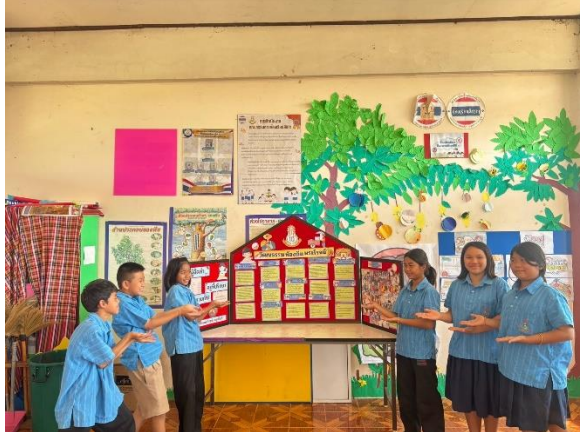
(การจัดนิทรรศการโครงการ)