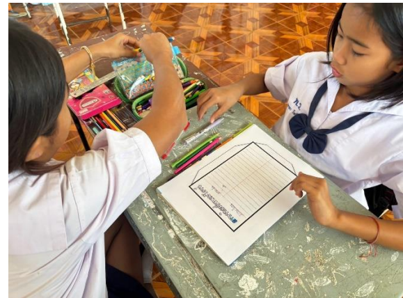
(การทำสื่อ ใบงาน เพื่อเรียนรู้และเผยแพร่วัฒนธรรมพระโขนง)