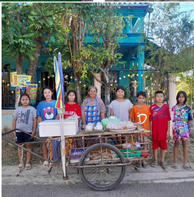
(การลงพื้นที่สำรวจวัฒนธรรมพระโรจน์)