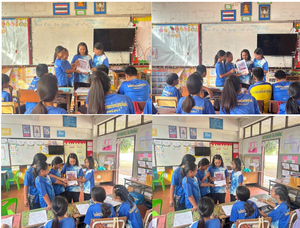
(การเผยแพร่วัฒนธรรมพระโรจน์ให้กับผู้อื่น)