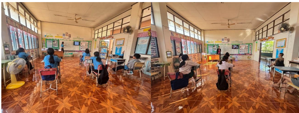
(การเรียนการสอนในห้องเรียน )